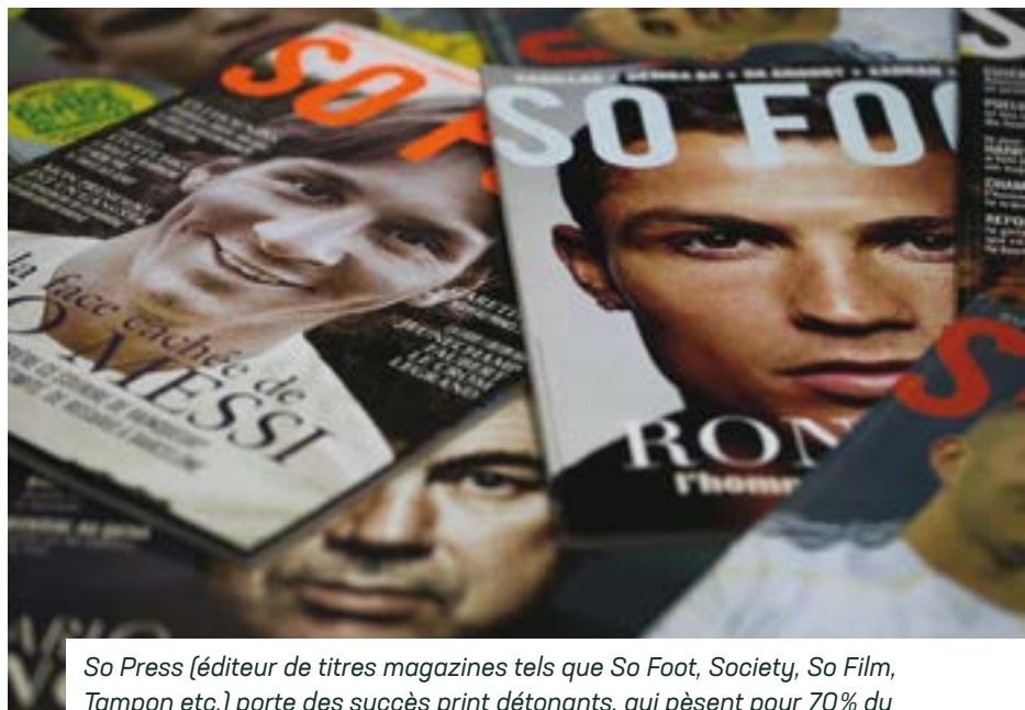
So Press (éditeur de titres magazines tels que So Foot, Society, So Film, Tampon etc.) porte des succès print détonants, qui pèsent pour 70% du chiffre d'affaires du groupe.